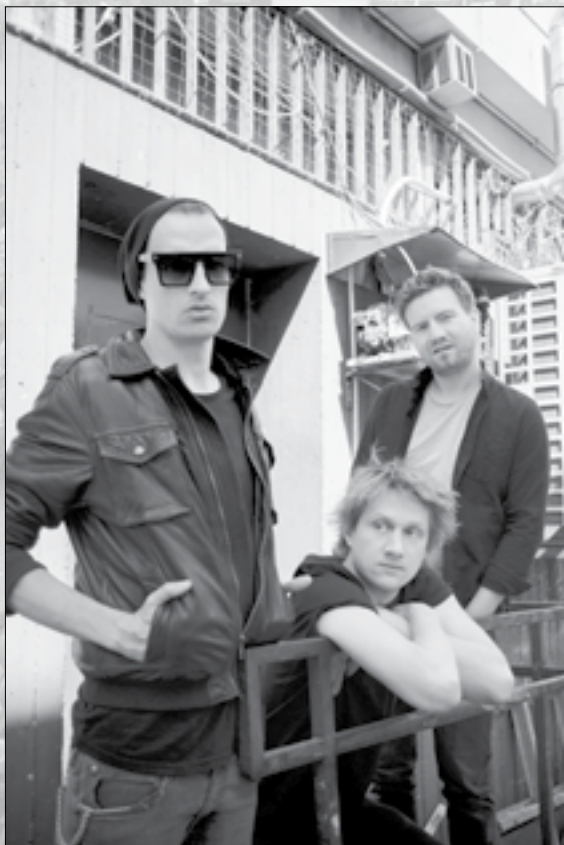
Spielten im Februar als Support-Act von WIZO in der Arena, heuer zum ersten Mal am Nova Rock: Schmutzki

Dass auch im letzten Jahrzehnt Bands gegrün- det wurden, die es zu hören lohnt, beweist vor allem die Stuttgarter Band Schmutzki . Sie sind mit Kraftklub, Feine Sahne Fischfil- let (die am Samstag zu hören sein werden) und Adam Angst die Speerspitze der neuen Post-Punk-Welle aus Deutschland, die nicht nur mit kraftvollen Gitarren und treibenden Rhythmen, sondern auch mit Texten mit Hal- tung überzeugen können.