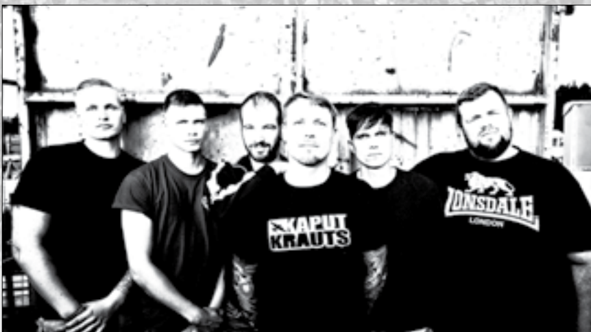
Darf man nicht versäumen: Feine Sahne Fischfilet spielen am Samstag.