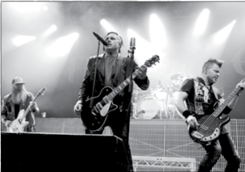
Spielen am ersten Tag: Three Days Grace, Foto: Ian Sommer

Wer heuer das Nova Rock besucht, erwarten über 80 Bands an vier Tagen auf drei Bühnen. Zusätzlich gibt es auch wieder die Singer-Songwriter-Bühne, deren Programm noch nicht feststeht. Mit dem Programm ist das Festivalteam kein Risiko eingegangen, aber es gibt sicher auch 2019 Bands, die es noch zu entdecken gilt.