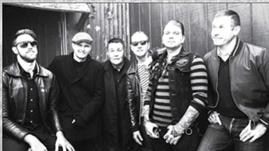
Irische Traditionals in Bostoner Punk-Interpretation: Dropkick Murphys